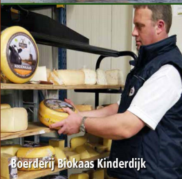
Boerderij Brokaas Kinderdijk